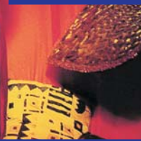
Velos y turbantes